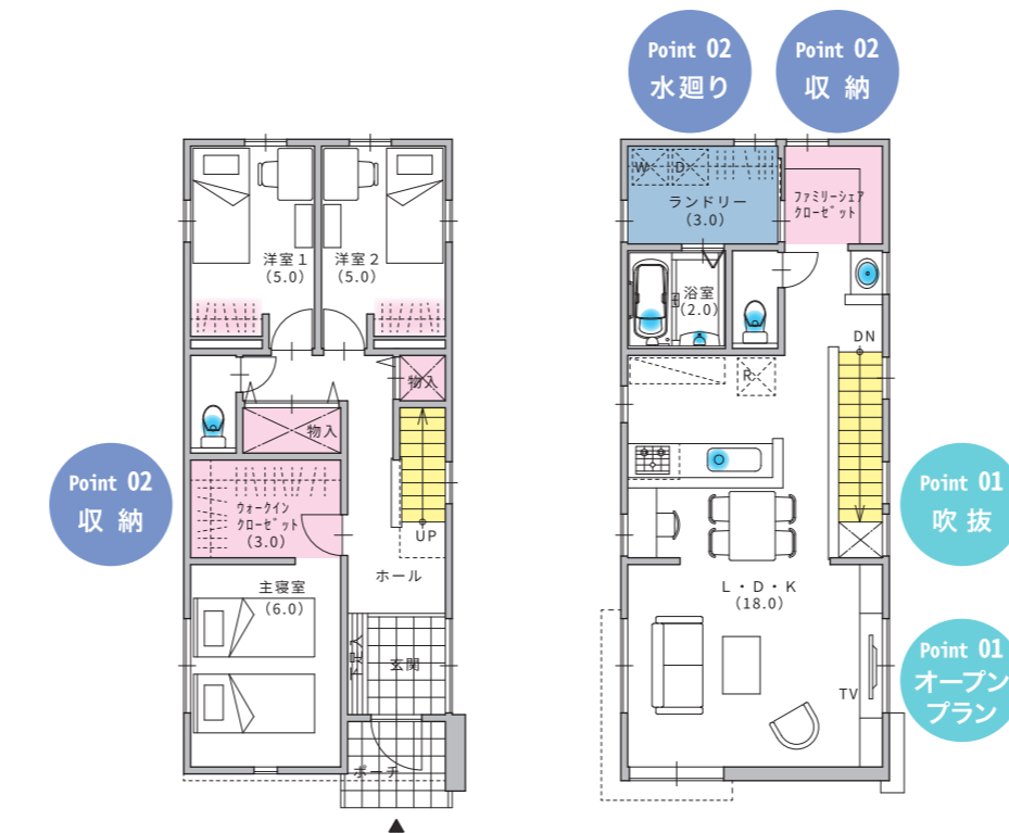
<2階LDKタイプ> PLAN No.14

狭小間口の家だからこそ重要となる収納計画にこだわり、適材適所の収納アイデアを多数収録。玄関収納やファミリークロークなどを効果的に配置し、生活空間をすっきりと保ちながら収納量を確保しています。 生活動線上にも収納を設けるなど、日々の片付けや家事がしやすく、暮らしやすさにつながる収納提案 が満載です。