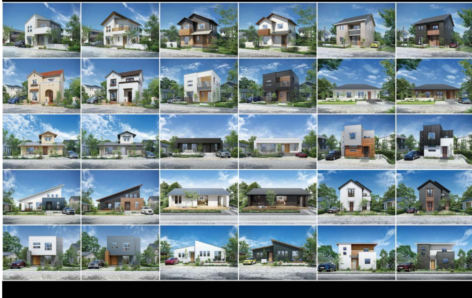
外観デザイン人気投票【全30パターン】